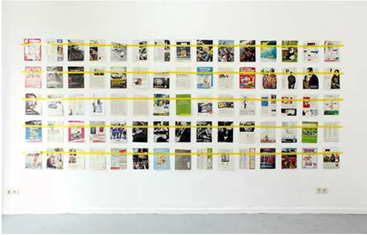
Ian Wallace, Magazine Piece , 1970/2012