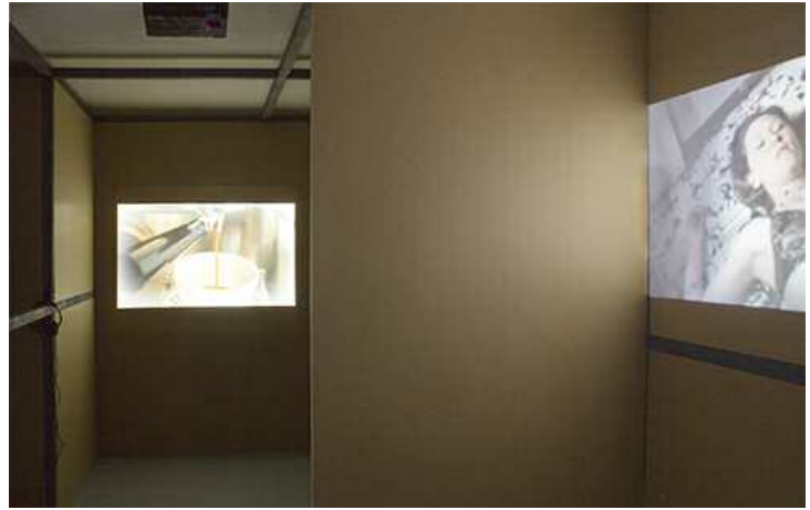
Keren Cytter, Avalanche , 2011